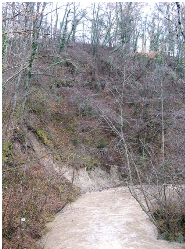
Sallenoves-EGT1 : Rivière des Petites Usse, en amont de Buidon – Affouillement et glissements de ber-