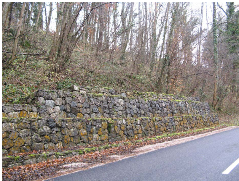
Sallenoves-OG1 : RD7, entre Bonlieu et le chef lieu – Succession de gabions pour conforter les talus au niveau des virages.