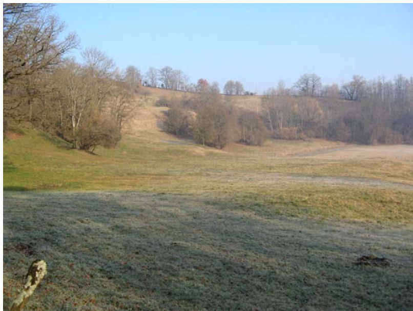
Sallenoves-EG1 : Coteaux situés à l'Est de la Tatte – Topographie irrégulière et anciennes loupes de glissements stabilisées.