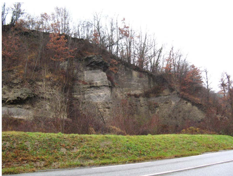
Sallenoves-EP1 : En bordure de la RN508, au Sud de Buidon – Ancienne carrière réhabilitée, bordée par un merlon de protection.