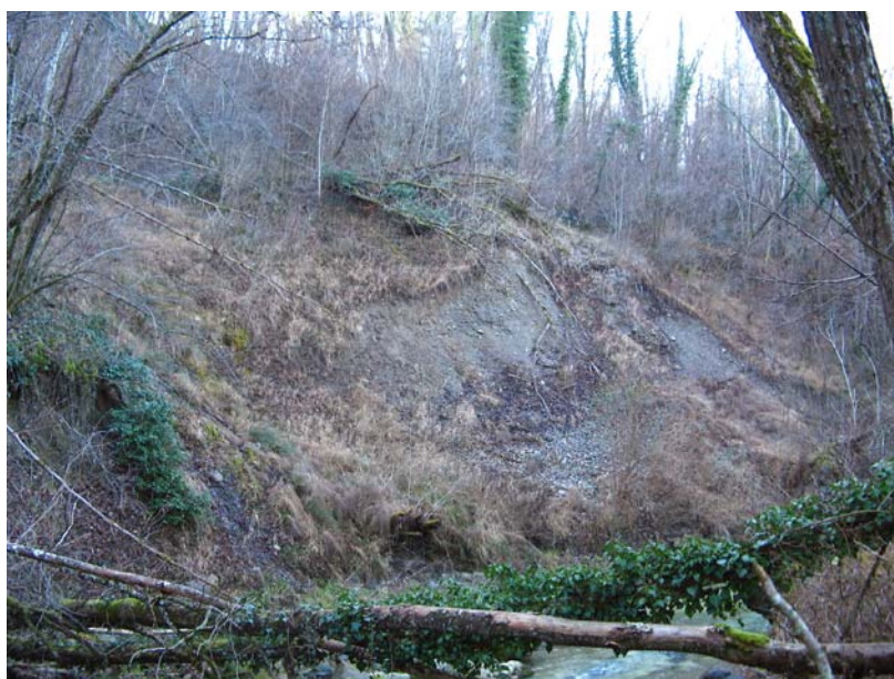
Sallenoves-EGT2 : Rivière des Petites Usse, à l'Ouest de Buidon – Affouillement et glissements de berges en rive gauche.