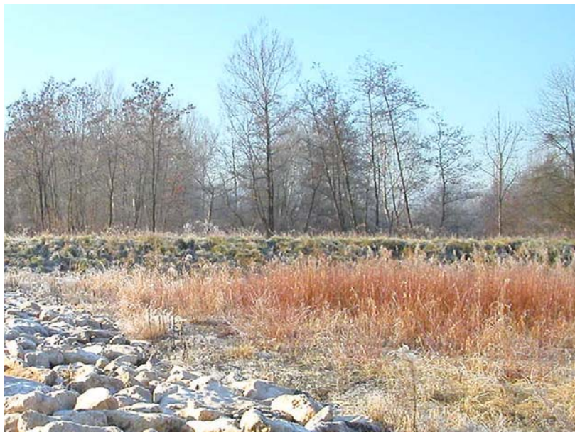
Scientrier-OT2 : L'Arve, au niveau du seuil en enrochements – Digue qui borde la rivière en rive gauche.