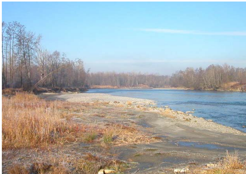
Scientrier-ET1 : L'Arve, en aval du seuil de Scientrier – Phénomènes d'érosion et de sapement au niveau des berges.