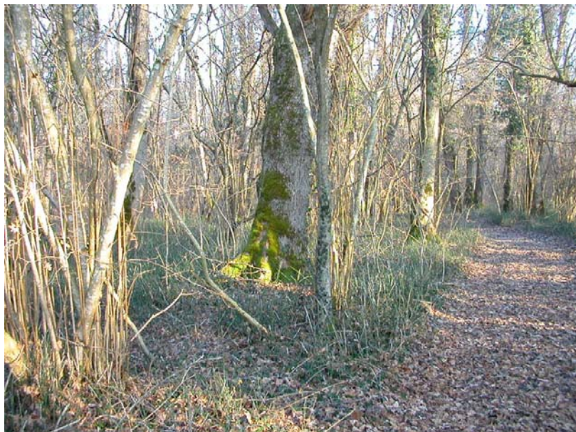
Scientrier-EH3 : Bords de l'Arve, entre l'A40 et la rive gauche – Forêts alluviales avec présence de prêles.