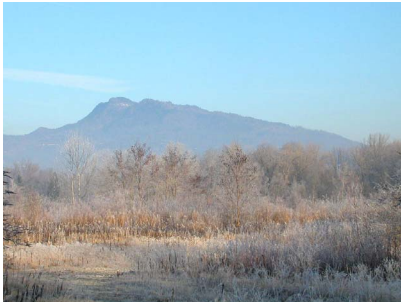
Scientrier-EH2 : Bords de l'Arve, entre l'A40 et la rive gauche, en amont du seuil – Zones humides.