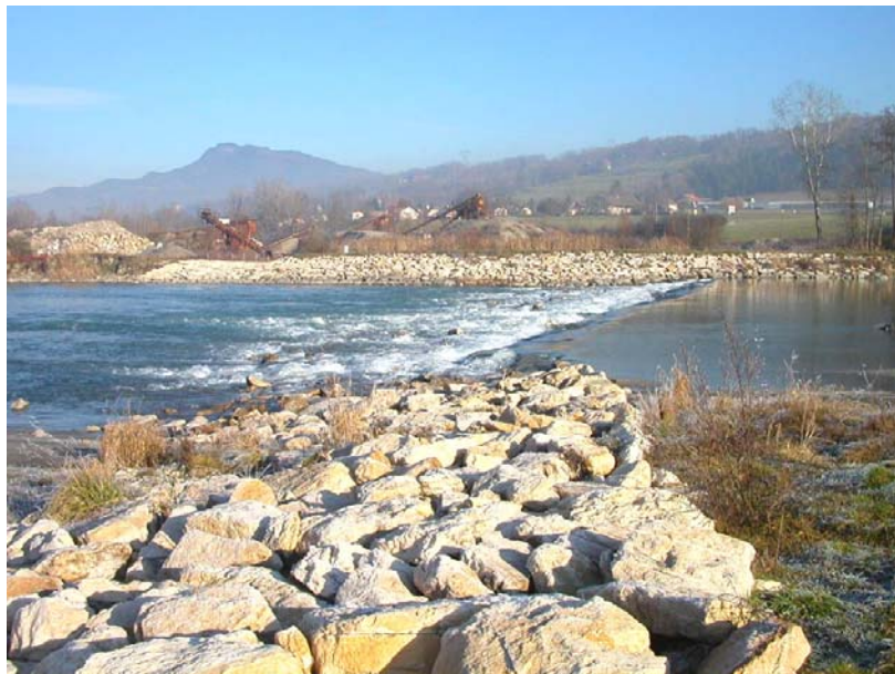
Scientrier-OT1 : L'Arve – Seuil en enrochements de Scientrier/Contamine.