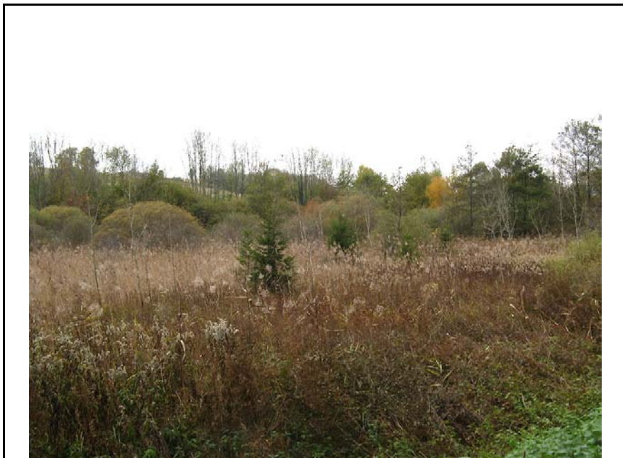
Nonglard-EH1 : En limite Nord de la commune, entre Petit Buisson et les Rinnes – Zone humide très diversifiée.