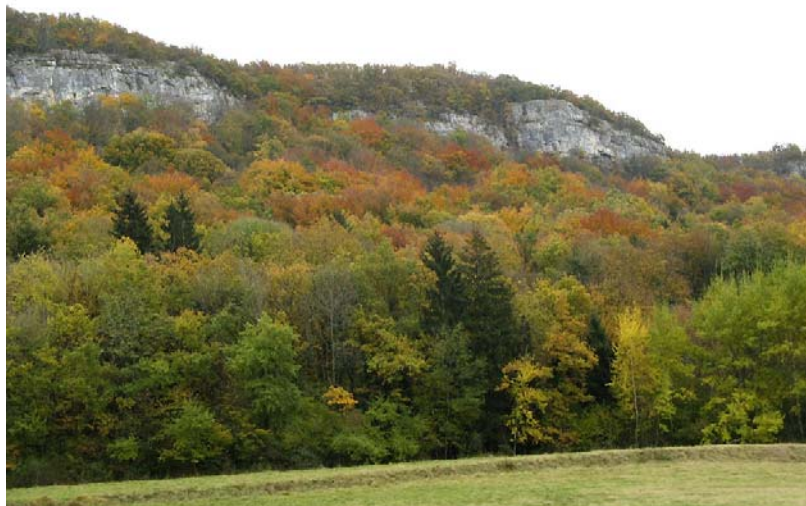
Nonglard-EP1 : Le Rocher de Nyre – Chutes de pierres possibles à partir des barres rocheuses boisées mais fracturées.