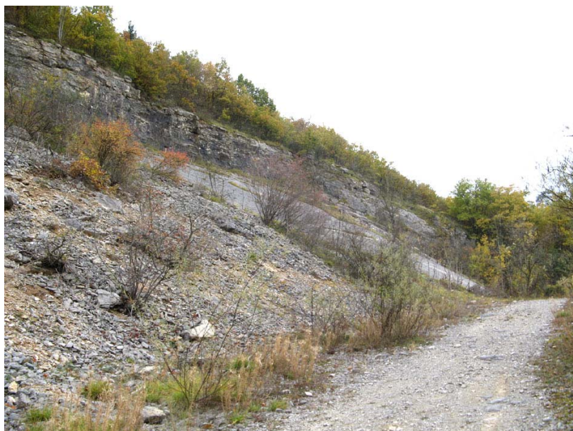
Nonglard-EP2 : Sur le versant Ouest de la Montagne d'Age – Ancienne carrière réhabilitée en site d'école d'escalade.