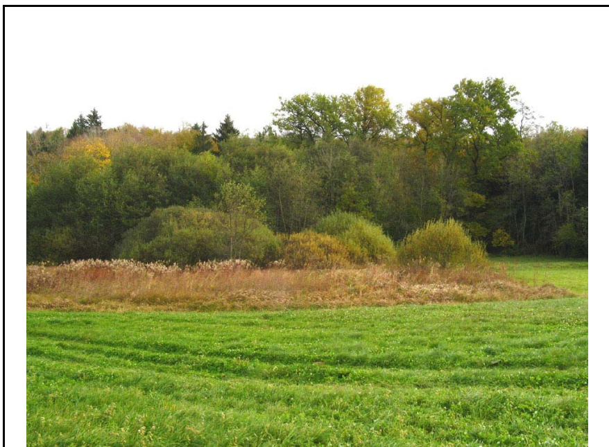
Nonglard-EH2 : Sur le versant Ouest du Bois de Loye – Petite zone humide en bordure de forêt.