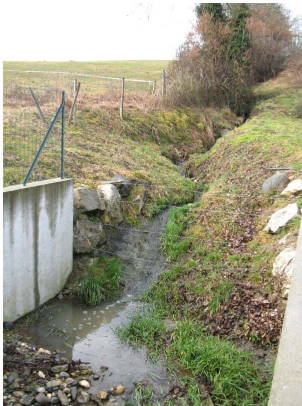
Veronnex-OT1 : RD910, hameau les Contamines – Piège à cailloux sur le ruisseau des Contamines en amont du busage sous la chaussée.