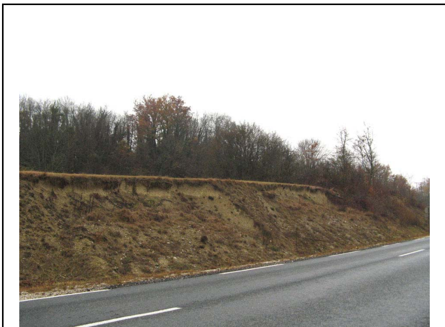
Versonnex-EG1 : RD910, au dessus des Vernays – Affaissement de talus routier après élargissement de la route.