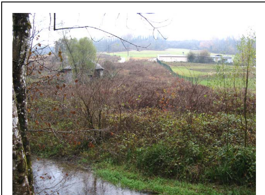
Versonnex-EH1 : Au niveau de la STEP, aux Vernays – Développement d'une zone humide entre la rivière et la STEP (phragmites).