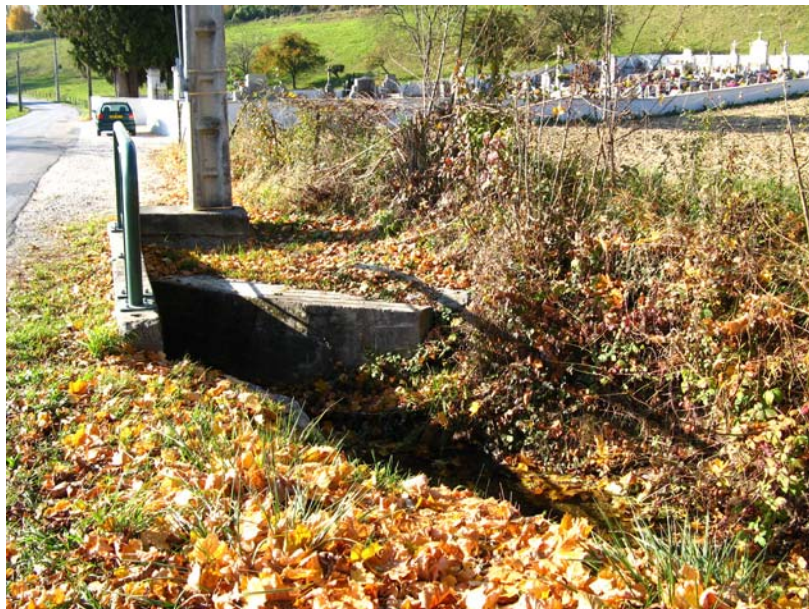
Hauteville-OT1 : Ruisseau de Lagnat, en amont de la RD14 – Renforcement de berges et busage sous-dimensionné.