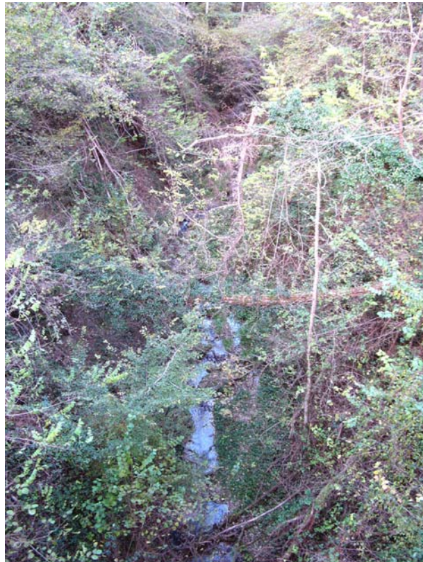
Hauteville-EG1 : Ravin de Merluz, à la RD14 – Large thalweg boisé déstabilisé et encombré de végétation.