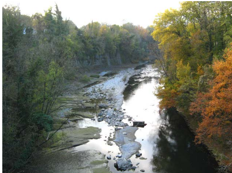
Hauteville-ET1 : Lit en aval du pont sur le Fier – Ecoulement de la rivière dans de larges gorges.