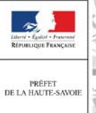
Schéma directeur du lac d'Annecy - Secteur 3 Arrêté n°DDT/DIR/UL/2015-0142 du 10 juin 2015