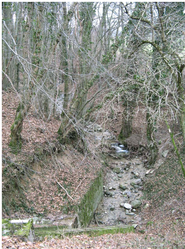
Chenex-OG1 : Rau de Chênex, en amont de la RD23 – Canalisation des eaux et renforcement des berges.