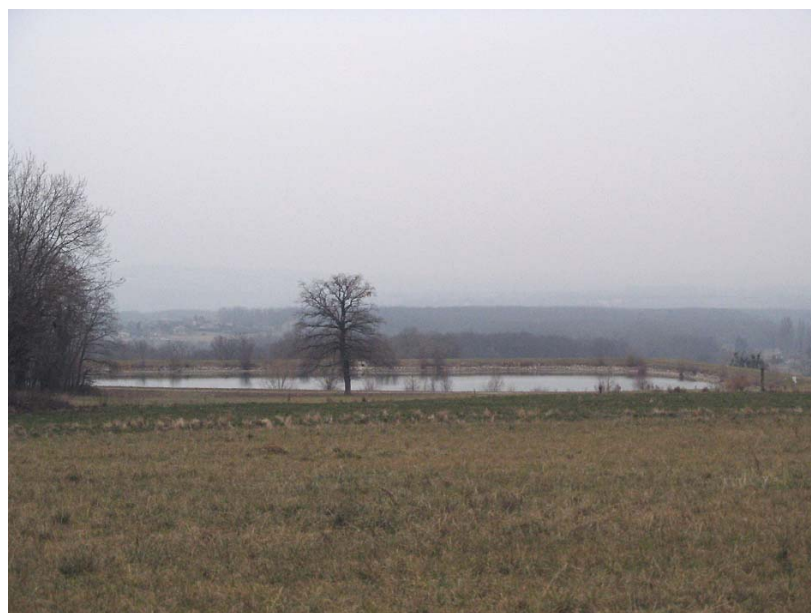
Chenex-EH1 : Le Vernay, au point coté 522m – Retenue artificielle.