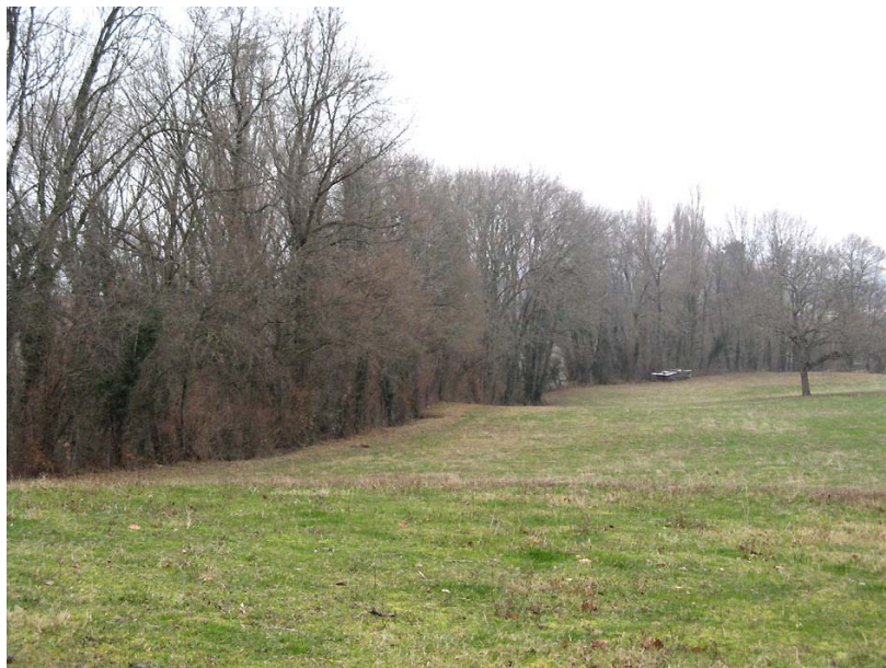
Chênex-EG1 : Ruisseau de Chênex, en aval de la RD23 – Vue éloignée du thalweg du ruisseau.