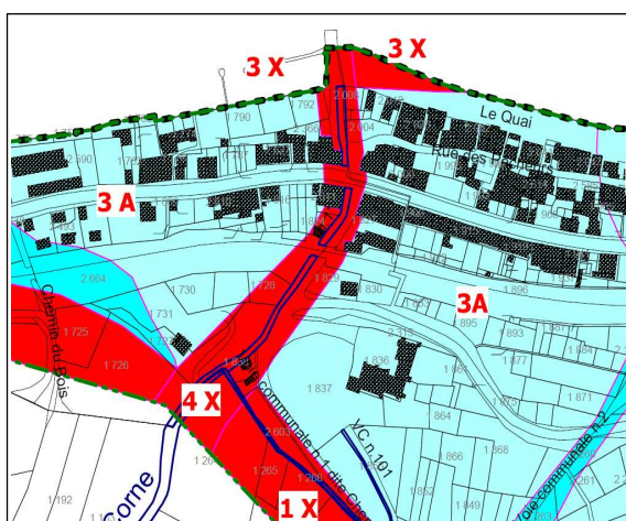
Extrait zonage PPR 23/11/2004

Cette zone d'aléa faible est traduite en zone bleue 18D.