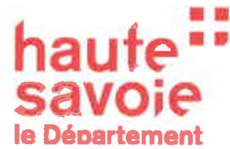
Schéma départemental d'accueil et d'habitat des gens du voyage de Haute-Savoie 2019-2025