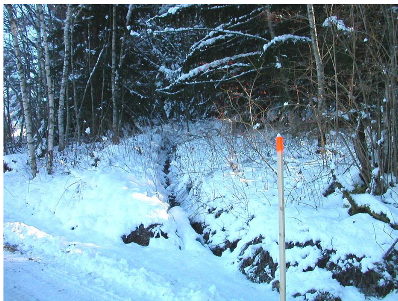
Combloux-OH1 : La Balancerie – Fossés de drainage de la zone humide en amont des lotissements.