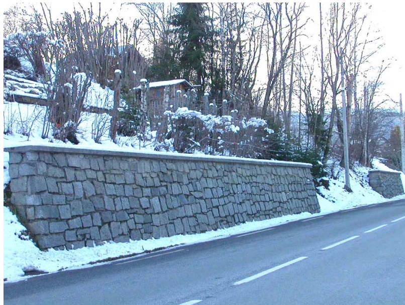
Combloux-OG1 : RD909, entre Bois Roulet et le Crêt – Confortement de talus par des murs en pierres maçonnées.