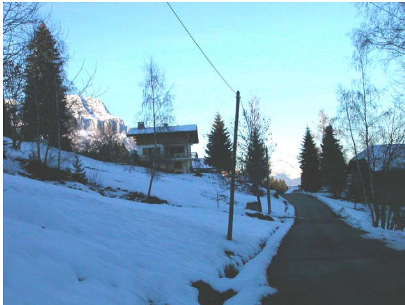
Combloux-EGH1 : Les Foyents – Zone humide de part et d'autre de la route, favorisant l'existence de glissements superficiels (poteau penché).