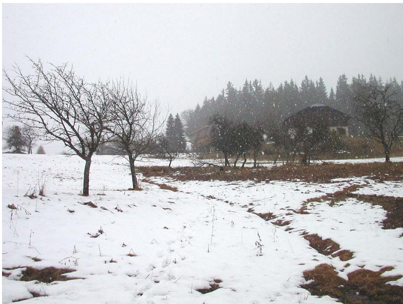
Combloux-EGH2 : Sous le Thural – Drainage d'une zone humide au milieu des prés.