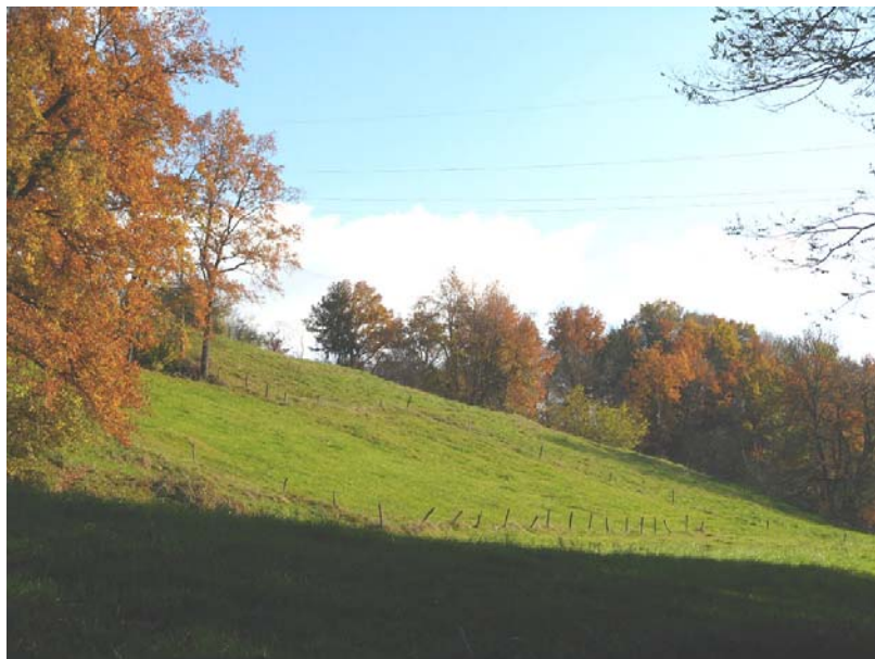
Marcellaz-EG2 : Pentes herbeuses sous Joudrain, au dessus de la RD16 – Glissements potentiels en raison de la géologie du terrain.