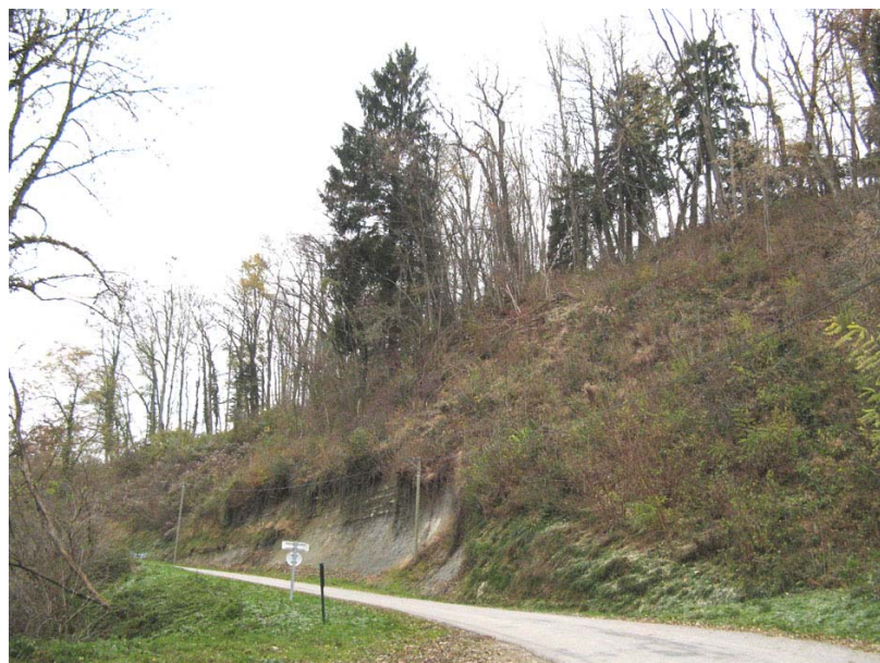
Marcellaz-EG3 : Entre Peignat et Germagny – Déstabilisation au dessus d'un large thalweg et affleurement de la roche mère.