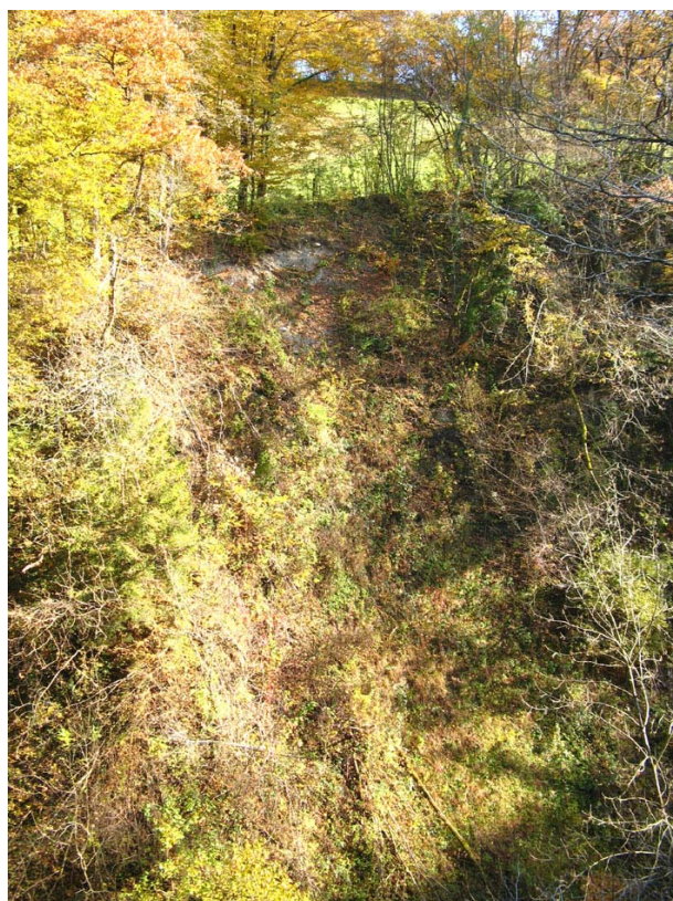
Marcellaz-EG1 : Thalweg du Nant de la Benolle – Rupture de pente brutale et déstabilisation du thalweg.