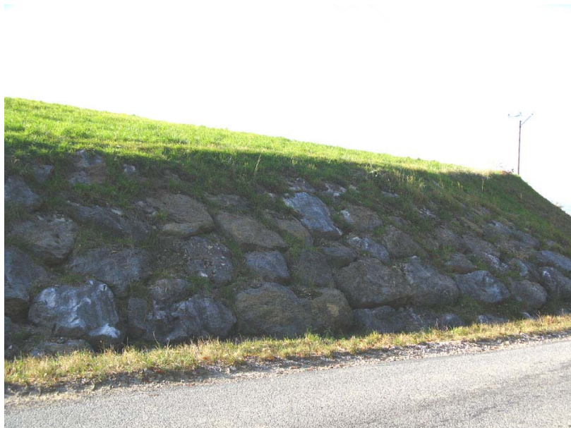
Marcellaz-OG1 : RD38, entre les Vorges et le chef lieu – Confortement du talus localement effondré par des enrochements.