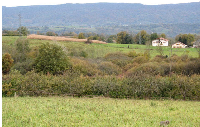
Marcellaz-EH1 : Entre Chez Rigaud et les Planchettes – Dépression occupée par une riche zone humide.