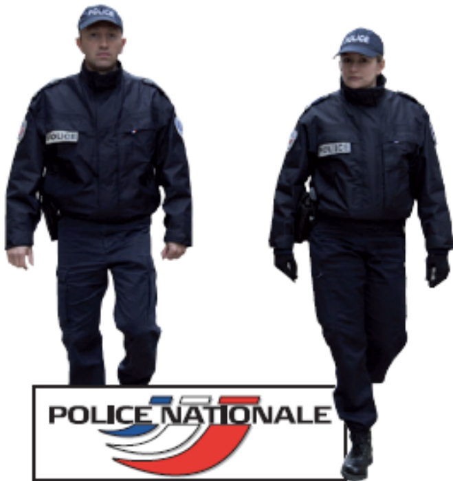
LE DISPOSITIF DU PATROUILLEUR POUR LA POLICE NATIONALE