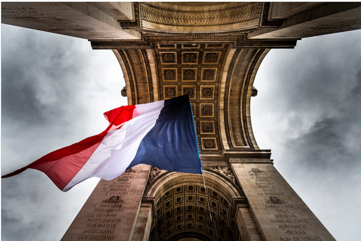
Figure 1: Drapeau Français flottant sous l'Arc de triomphe – Paris - 2021